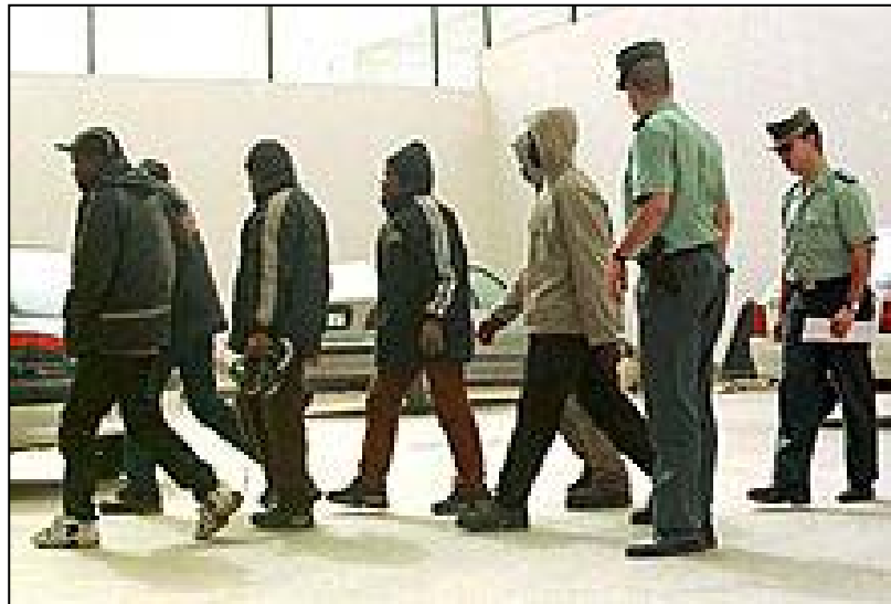
Detención de inmigrantes

En el aspecto fotográfico no se contextualiza la información fotográfica ni los protagonistas. A veces se juntan imágenes tópicas con informaciones en las que se hace referencia a los inmigrantes como sujetos pasivos y poco cualificados.