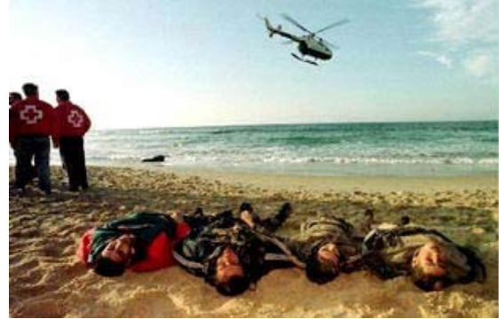
Muerte en las playas españolas