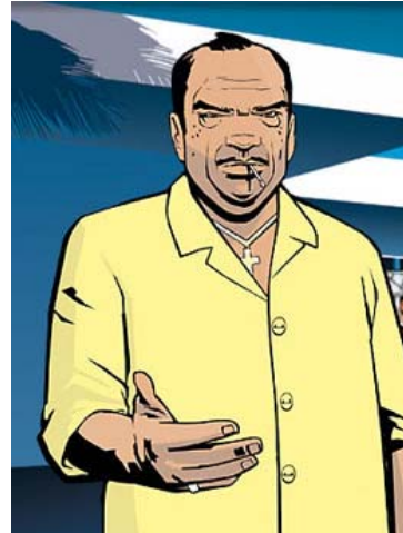
GTA Vice City (Rockstar)

De entre las siguientes características, elige aquellas que consideres que habitualmente son comunes a todos los “enemigos” (excepto los fantásticos) que has visto en los videojuegos que recuerdes: