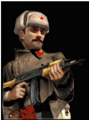
Rise of Nations (Microsoft & Big)

Observa las imágenes de los “enemigos” (los “malos”) de algunos de los videojuegos más vendidos actualmente: