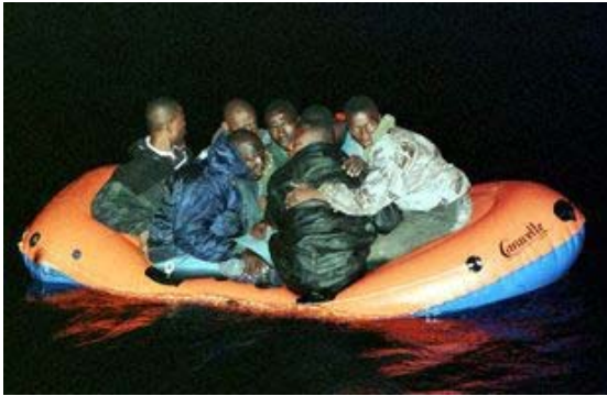
En "patera" por el Estrecho