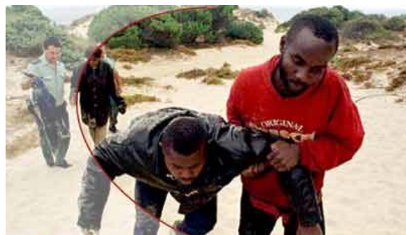
Llegada a las playas españolas